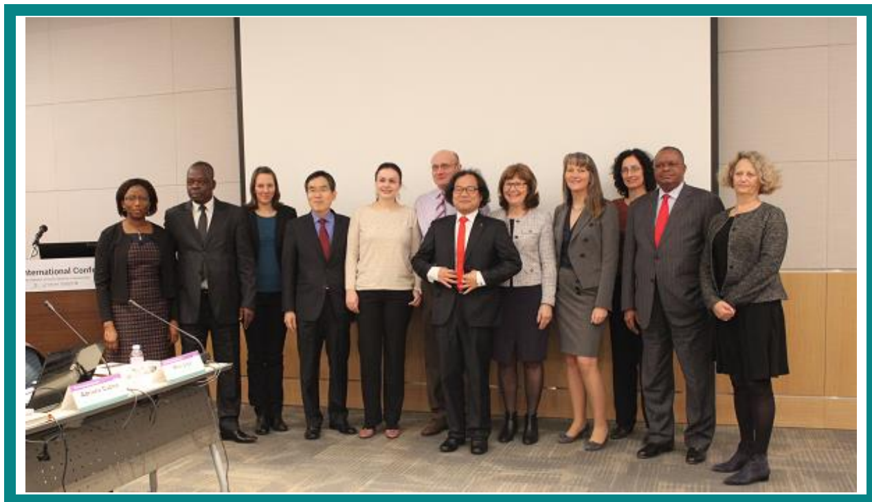
Membres du Comité Exécutive présents